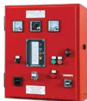
Basic Control Pump