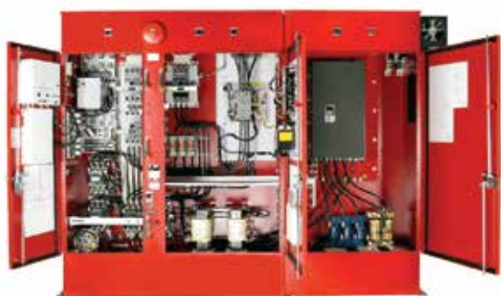
Basic Control Pump