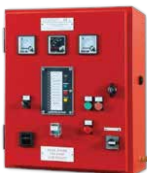
Basic Control Pump